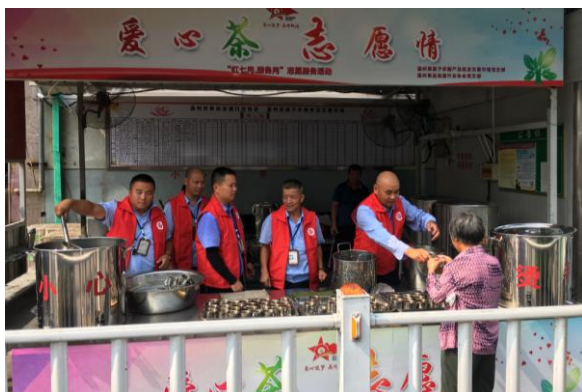
公益茯茶 清新你我