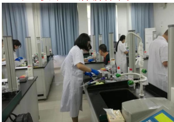
保障舌尖上的安全