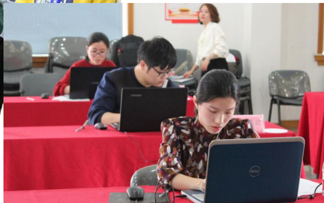
◎新闻媒体现场比武