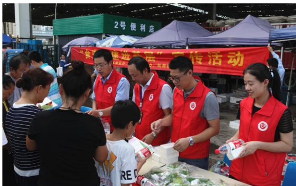
食品安全“你点我检”